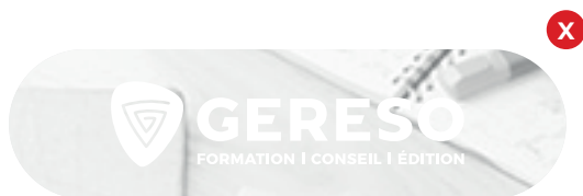
Utilisation logo monochrome blanc