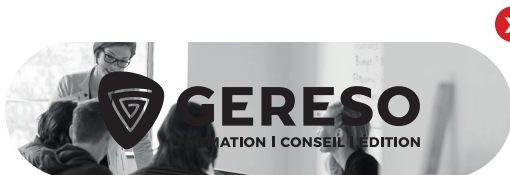
Utilisation logo monochrome noir