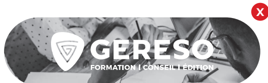
Utilisation sur fond photo trop chargé