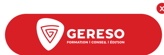
Modification des proportions